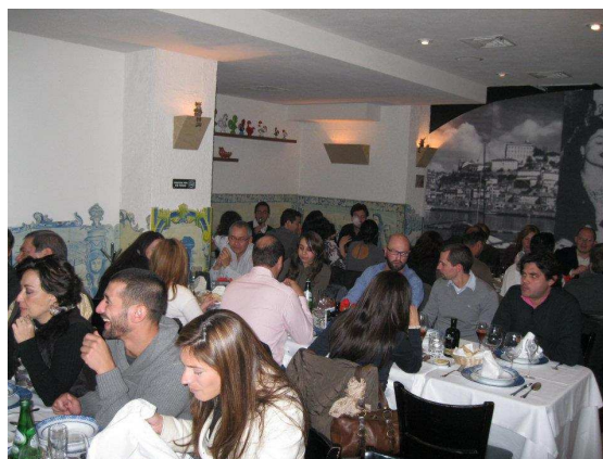
Imagen de la cena luso-mexicana del 3 de diciembre de 2011.

La cena realizada reunió más de 40 personas y el próximo encuentro se realizará a finales de enero.