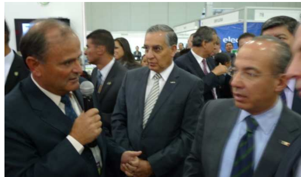
El discurso del Presidente Felipe Calderón y su visita al Pabellón de Portugal dialogando con el Sr, Embajador de Portugal