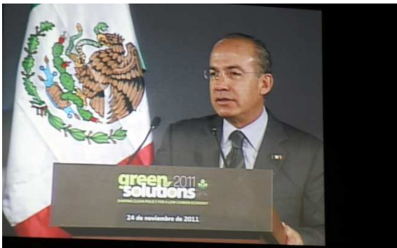
A intervenção do Presidente Felipe Calderón e a sua visita ao Pavilhão de Portugal dialogando com o Sr, Embaixador de Portugal