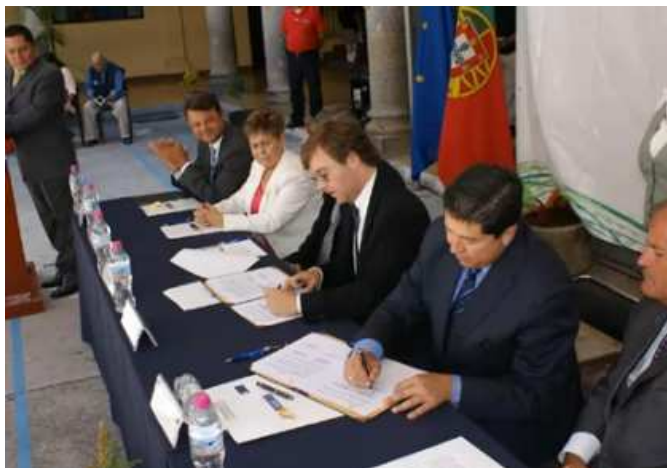
Assinatura do Memorando de Cooperação entre Portugal e o Estado de Jalisco

El Sr. Secretario de Estado también se reunió con la Comunidad Portuguesa en México para enterarse sobre sus actividades profesionales, oportunidades de negocios en México y de lo que podría ayudar a los negocios de las empresas portuguesas en México.