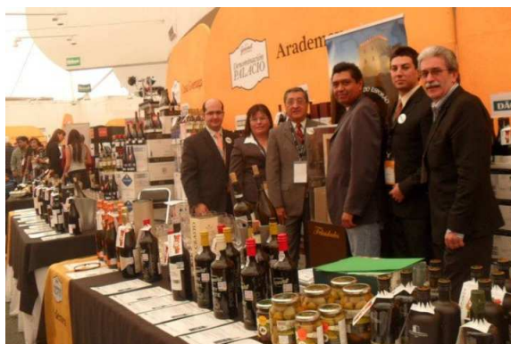
Stand da empresa Aradamex com produtos portugueses