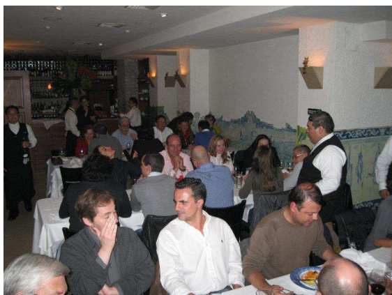
Imagem do jantar luso-mexicano de 3 de Dezembro de 2011.

O jantar conseguiu reunir mais de 40 pessoas e o próximo encontro deverá realizar-se em finais de Janeiro de 2012.