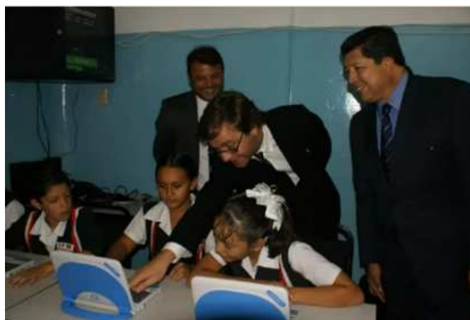
O Sr. Secretário de Estado interagindo com os alunos da Escola Primária, que estavam a usar computadores Magalhães.