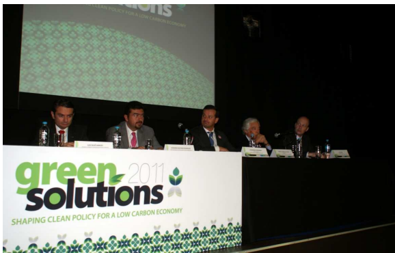
Aspectos da Mesa do Seminário e do Pavilhão de Portugal

La Misión Empresarial fue integrada por la EDP Internacional, Efacec, Martifer Solar, Magnum Cap, Janz, Sunaitec, Tekever, Ecochoice, Richworld Renewables, VitroChaves y Advank. Fueron agendadas por ACIEP con el apoyo de CCILM alrededor de 50 reuniones bilaterales entre empresas portuguesas e instituciones y empresas mexicanas.