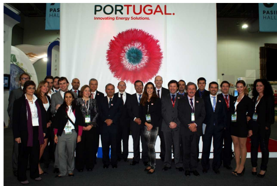
A Missão Empresarial Portuguesa