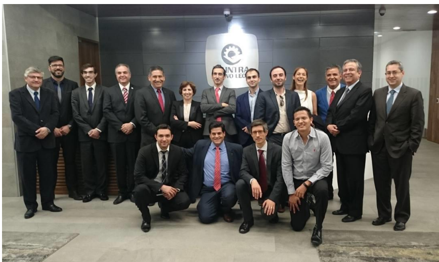
1.ª Ação – Missão Empresarial