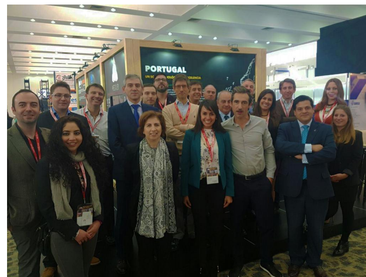
4.ª Ação – Feira Auto Industry e Missão Empresarial