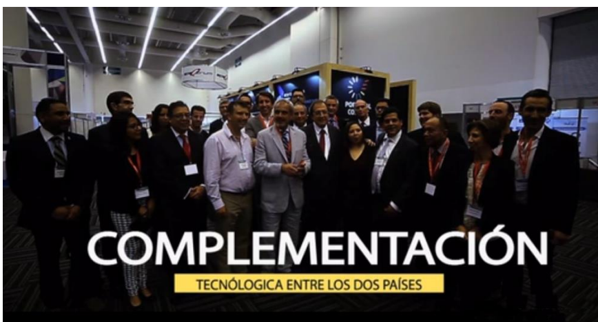
3.ª Ação – Feira Aerospace e Missão Empresarial