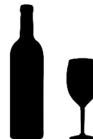
Vinos y Licores