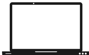
TIC ( desarrollo de software, hardware, conectividad, servicios)