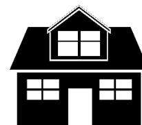
Hogar (decoración, textil hogar, cerámica, vidrio, mobiliario de interior y exterior)