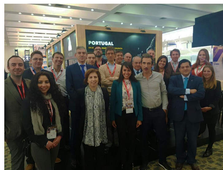
4.ª Ação – Feira Auto Industry e Missão Empresarial