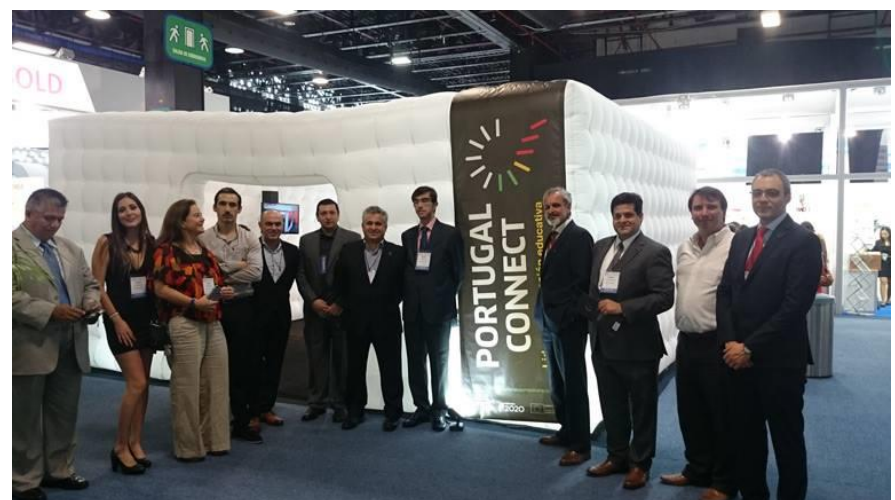
2.ª Ação – Feira GESS e Missão Empresarial