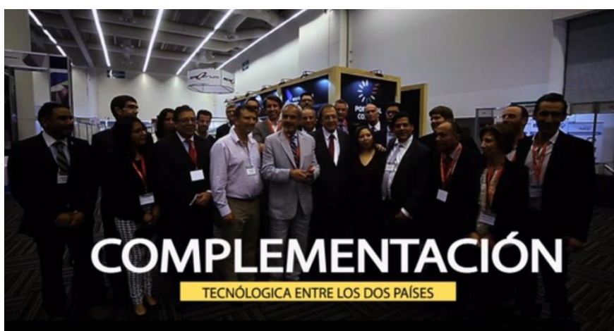
3.ª Ação – Feira Aerospace e Missão Empresarial