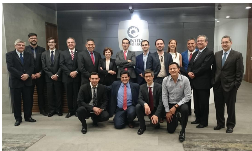
1.ª Ação – Missão Empresarial